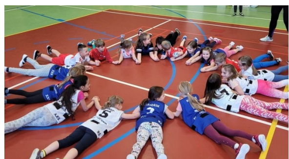
Trenéři do škol