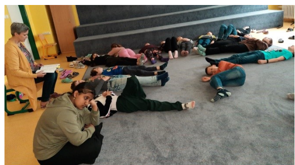
Relaxace s psycholožkou