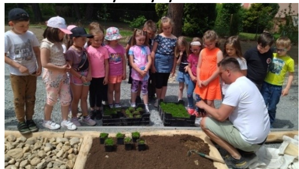
Nová školní zahrada